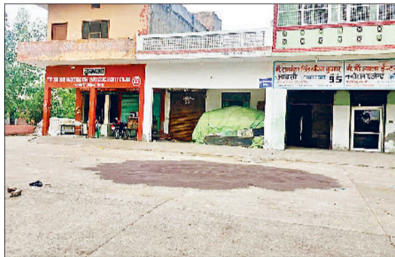
जींद। मंडी में आई सरसों फसल।

खरीद सुचारु रूप से चलाने के लिए बारदाना, उठान व लेबर के टेंडर जल्द शुरू किए जाएंगे