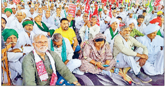
जीद। रैली में मौजूद किसान।