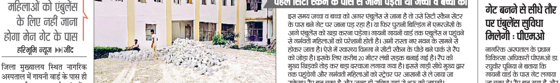
जौद। रैंप पर ब्लॉक्स लगाते हुए मजदूर।

पहले सिटी स्कैन के पास से जाना पड़ता था जच्चा व बच्चा को