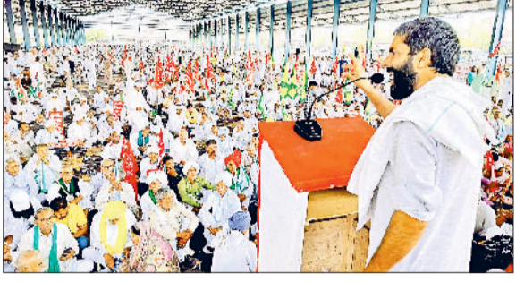
जीद। रैली को संबोधित करते हुए किसान नेता।