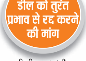
हरिभूमि न्यूज ॥ जीद

सरकार किसानों के हित-देश की खाद्य सुरक्षा अमेरिका को सौंप रही : सिंह