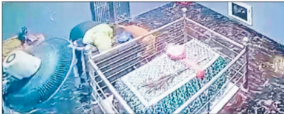
कलायत स्थित श्री जाहर वीर गोगा पीर के दान पात्र से राशि सुरता नकाबपोश चोर।

अप्रैल माह में नई खेल नर्सरियां अलाट होंगी। पिछले सत्र में जिले में 58 खेल नर्सरियां ग्राम पंचायतों व सरकारी स्कूलों को अलाट थी। एक नर्सरी में 25 खिलाड़ी अभ्यास करेंगे। खिलाड़ी को माह में 22 दिन हाजिरी लगानी अनिवार्य होती है। हाजिरी के आधार पर ही खिलाड़ियों को डाइट राशि प्रदान की जाती है।