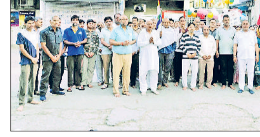
उचाना। महावीर जयंती पर आयोजित कार्यक्रम में पहुंचे लोग।