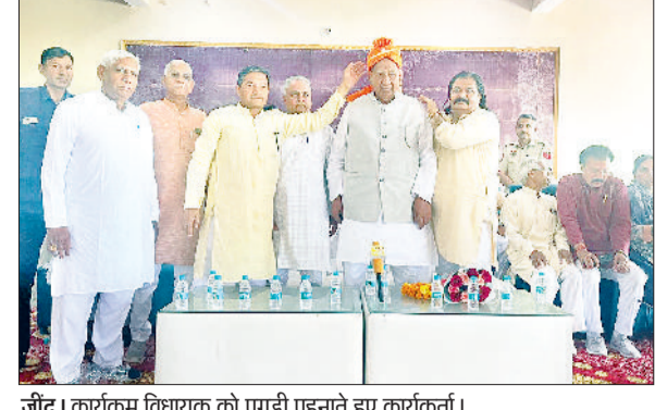
जीद। कार्यक्रम विधायक को पाड़ी पहनाने हुए कार्यकर्ता।

उचाना। करीब 10 महीने से उचाना की राजेंद्र कालोनी में अतिरिक्त मंडी के पास चल रहे खाटू श्याम मंदिर का निर्माण कार्य कई माह में पूरा होगा। यहां पर 710 गज जमीन में इसका निर्माण हो रहा है। मंदिर उद्घाटन पर प्रसिद्ध कलाकार कन्हैया मितल आएंगे। मंदिर का निर्माण कार्य तेजी से चल रहा है। निर्माण का कार्य देख रहे विकास गर्ग, गौरव जैन, अनूप अग्रवाल, रिकू गर्ग, अमित जैन, अशोक जैन ने बताया कि निरंतर मंदिर निर्माण को लेकर खूब सहयोग राशि खाटू श्याम भगत दे रहे हैं। करीब दो करोड़ रुपये इसके निर्माण पर खर्च होंगे। मंदिर होल का निर्माण हो चुका है। अब छह कमरों एवं हॉल का निर्माण पहली मंजिल पर हो रहा है। यहां पर लिफ्ट भी लगाई जाएगी। आधुनिक कमरों का निर्माण होगा ताकि यहां रुकने वाले श्रद्धालुओं को किसी तरह की परेशानी न हो।