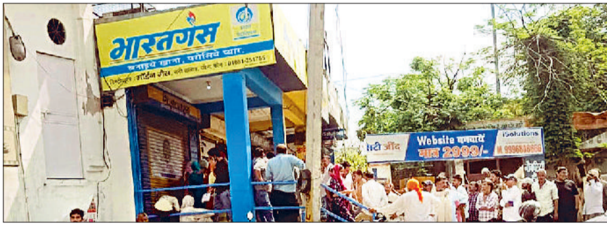
जौद। गैस एजेंसी के बाहर लगी सिलेंडर परी के लिए लाइन।

जिले में 24 गैस एजेंसियों व 178 पेट्रोल पंप, आपूर्ति में कोई कमी नहीं आमजन से अनावश्यक रूप से स्टॉक व जमाखोरी न करने की अपील