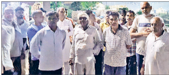
जीद। विरोध जताते हुए कालोनीवासी।