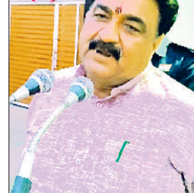
जीद। कालोनीवासियों को संबोधित करते हुए डा. कृष्ण मिड्डा।

हरियाणा विधानसभा के डिप्टी स्पीकर डॉ. कृष्ण मिड्डा ने कहा कि प्रदेश सरकार द्वारा शहरी क्षेत्रों के समग्र, संतुलित एवं योजनाबद्ध विकास के लिए निरंतर प्रभावी कदम उठाए जा रहे हैं। सरकार की प्राथमिकता है कि शहरों में बुनियादी सुविधाओं का सुदृढीकरण हो, नागरिकों को बेहतर जीवन स्तर उपलब्ध हो तथा विकास का लाभ समाज के प्रत्येक वर्ग तक पहुंचे। डिप्टी स्पीकर भारत नगर एवं इम्प्लॉयज कॉलोनी क्षेत्र में आयोजित जनसंपर्क अभियान के दौरान क्षेत्रवासियों को पांच अप्रैल को मुख्यमंत्री नायब सिंह सैनी की जीद में आयोजित होने वाली धन्यवाद एवं विकास रैली में शामिल होने का निर्माण दे रहे थे। इस अवसर पर डा. मिड्डा ने कहा कि मुख्यमंत्री के नेतृत्व में प्रदेश सरकार विकास के नए आयाम स्थापित कर रही है। उन्होंने बताया कि जीद सहित पूरे क्षेत्र में सड़कों का सुदृढीकरण, पेयजल व्यवस्था को विस्तार, सीवरेज सिस्टम का सुधार, सफाई व्यवस्था को आधुनिक बनाना तथा अन्य मूलभूत सुविधाओं को मजबूत करने के लिए लगातार कार्य किए जा रहे हैं। उन्होंने शहरवासियों से अपील करते हुए कहा कि वे अधिक से अधिक संख्या में रैली में पहुंच कर मुख्यमंत्री के विचारों को सुनें तथा क्षेत्र के विकास में अपनी सक्रिय भागीदारी सुनिश्चित करें। उन्होंने कहा कि यह रैली केवल एक कार्यक्रम नहीं बल्कि विकास के प्रति जनभागीदारी का एक महत्वपूर्ण अवसर है। डा.